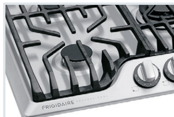
Table de cuisson en acier inoxydable

Préparez des plats divers et variés avec précision, qu'il s'agisse de faire mijoter, sauter, saisir ou bouillir.