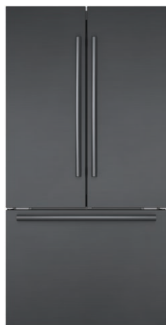
B36CT80SNB Acier inoxydable

Série 800 – Acier inoxydable noir B36CT80SNB