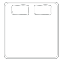
Très grand lit