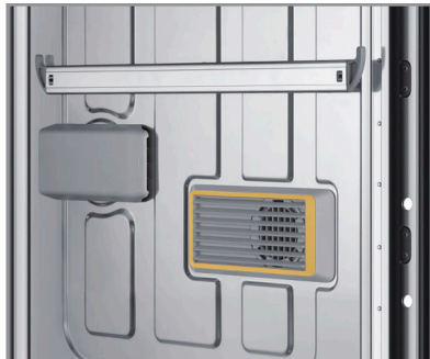
Smart Dry avec porte AutoRelease™

Acier inoxydable noir résistant aux empreintes digitales