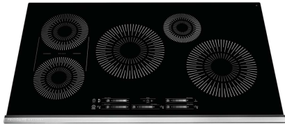
Table de cuisson à induction