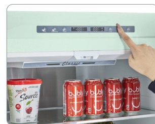
Panneau de commande numérique intuitif