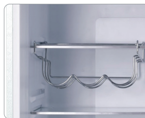
Casier à vin réglable pour trois bouteilles