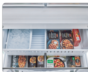
Congélateur sans givre avec machine à glaçons