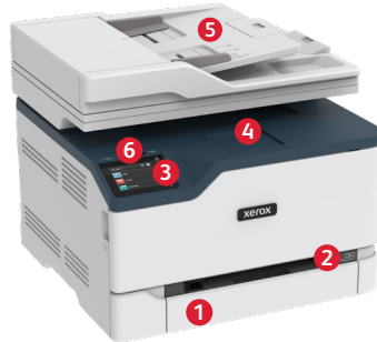
Imprimante couleur multifonction C235 de Xerox®