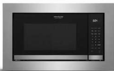
30" STAINLESS TRIMKIT (GMTK3068AF)