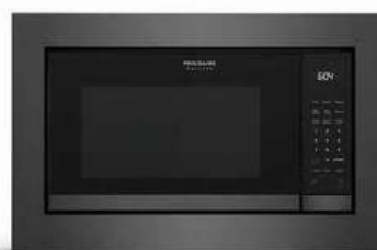
27" DARK STAINLESS TRIMKIT (GMTK2768AD)

* MICROWAVE (GMBS3068BD) PICTURED ABOVE PAIRED WITH BLACK STAINLESS STEEL TRIM KIT (GMTK3068AD / GMTK2768AD)