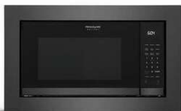
30" DARK STAINLESS TRIMKIT (GMTK3068AD)