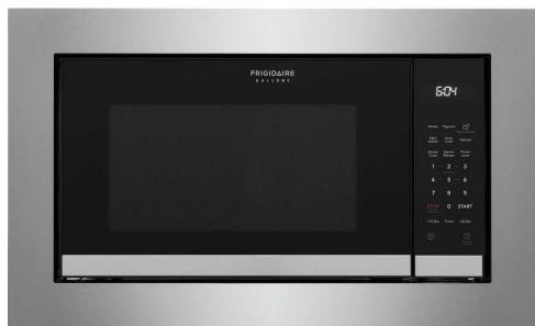
Install Trim Kit Required. Multiple sizes available.