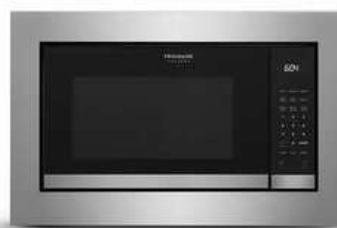
27" STAINLESS TRIMKIT (GMTK2768AF)

* MICROWAVE (GMBS3068BF) PICTURED ABOVE PAIRED WITH STAINLESS STEEL TRIM KIT (GMTK3068AF / GMTK2768AF)