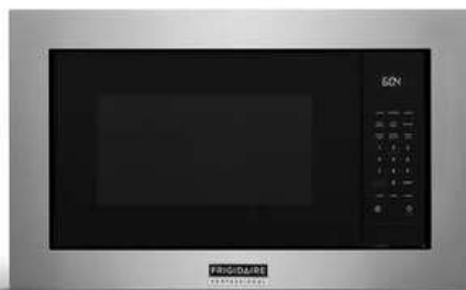
30" Stainless trim kit PMTK3080AF