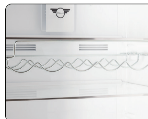
Rack à vin (5 bouteilles)