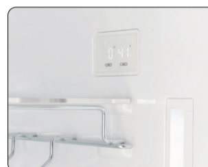
Panneau de commande numérique avec lumières DE