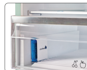
Bacs à légumes à contrôle d'humidité avec filtre