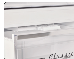
Bacs à glaçons avec supports de bac