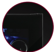
VITRE TEINTÉE SANS CADRE

** Pour cet article, les pièces sont disponibles et la réparation peut être effectuée dans un délai raisonnable.