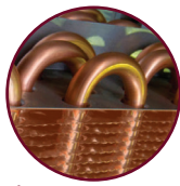
ÉVAPORATEUR EN CUIVRE