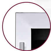
PORTE SANS JOINT