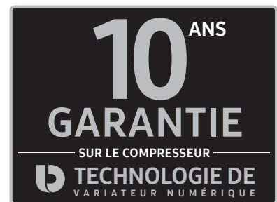
Compresseur à variateur numérique