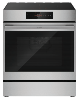
HIF5050MC Acier inoxydable

Faites l'expérience d'une grande précision culinaire avec la cuisinière à induction encastrable Série 500 de Bosch, qui allie un rendement avant-gardiste à un design intemporel pour n'importe quel budget, et ce, avec la qualité Bosch.