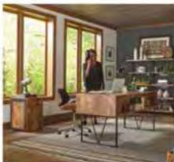
Travaillez Meubles de bureau

Inspirés par la créativité de diverses cultures du monde, nous avons sélectionné une grande variété de styles de meubles pour toucher la vie de ceux qui cherchent à bien vivre.