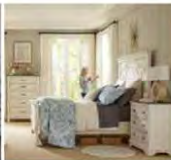
Reposez-vous Meubles de chambre