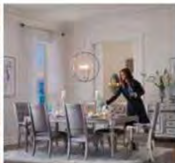
Mangez Meubles de salle à manger