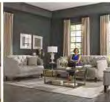
Vivez Meubles de salon